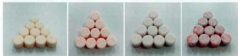
图6 过硫酸氢钾复合盐底改