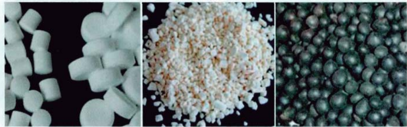
图5 普通氧化型底改